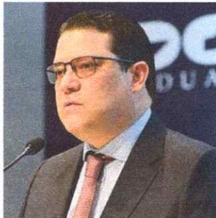
Yayo Sanz Lovatón, ministro del MICM.

Como resultado de esa visión, las exportaciones dominicanas han pasado de ser esencialmente textiles, las cuales requieren una mano de obra rudimentaria, a que actualmente el 35% sea de insumos médicos y ya un 15% sean de insumos electrónicos, productos que requieren empleos más